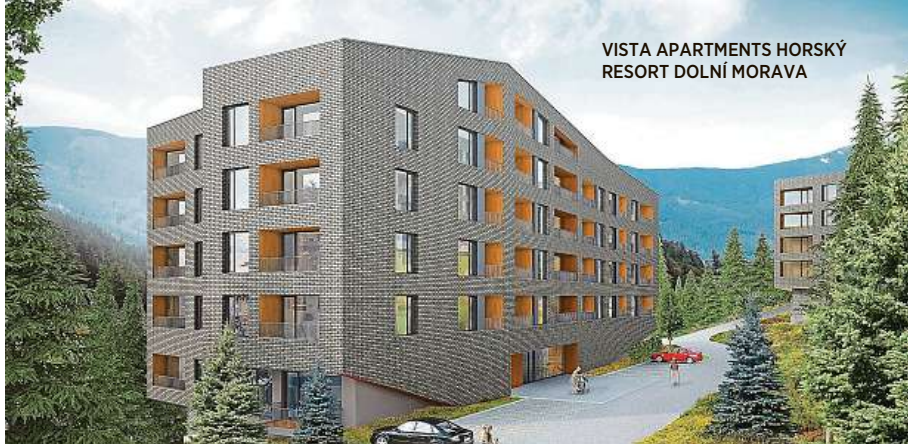
VISTA APARTMENTS HORSKÝ RESORT DOLNÍ MORAVA

Z letní nabídky určitě stojí za zmínku nejdelší visutý most pro pěší na světě Sky Bridge 721, oblíbená Stezka v oblacích, nejdelší bobová dráha v Česku, poctivě vybudovaný Trail Park s třiceti kilometry tras všech úrovní nebo Mamutíkovy dětské parky s obřím mamutem s výškou 13 metrů. Navíc těsná blízkost národní přírodní rezervace Králický Sněžník vytváří skvělou příležitost k turistice i cykloturistice.