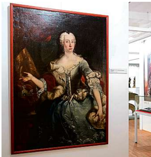
MARIE TEREZIE SAVOJSKÁ

Dnes je pozapomenuta, přesto patřila k největším mecenáškám 18. století v Čechách. Marie Terezie Savojská (1694–1772) mohla prožít život jako jiné šlechtičny 18. století, její otec byl Jan Adam I. „Bohatý“ z Lichtenštejna. On to byl, kdo koupil dvě panství v Alpách – Vaduz a Schellenberg, které spojil do nového knížectví, jemuž s císařovým svolením dal svoje jméno. On také vybudoval oba vídeňské paláce, které dnes obdivují návštěvníci rodové sbírky. Kníže přežil oba své syny a kvůli sporům s příbuznými odkázal část svého obrovského majetku dceři.