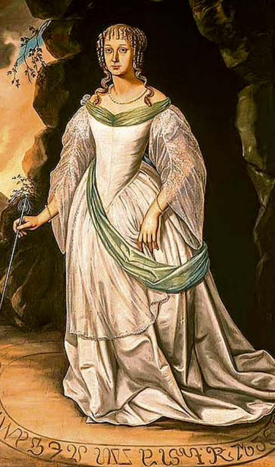
PERCHTA Z ROŽMBERKA

N a každém jihočeském zámku ukazují průvodci obraz s renesanční dámou v bílém, přidávají pověst o ochránkyni pánů z Růže a někdy i příběh paní Perchty z Rožmberka a jejího nešťastného manželství. Dávná pověst se spojila se skutečným příběhem už v 17. století. Barokní historik, jezuita Bohuslav Balbín, hledal v rožmberském archivu původ legendy o bílé paní, která měla ochraňovat příslušníky rodu. Ta se měla odpradávná zjevovat na jihočeských hradech a být ochránkyní jejich obyvatel. V archivu našel Perchtiny dopisy otci a ta se mu se svým smutným osudem hodila. Bílá paní dostala jméno a srdcervoucí příběh.