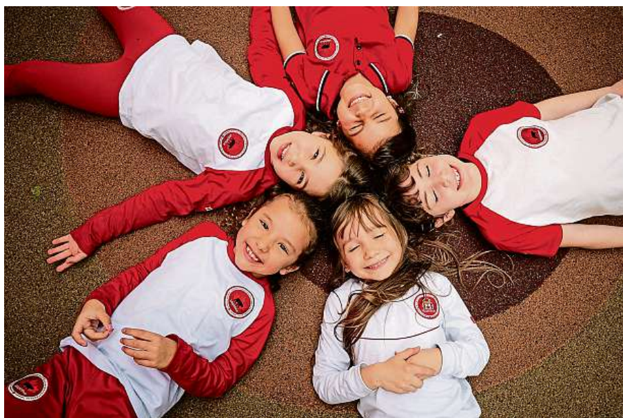
MAPLE BEAR SOUKROMÁ KANADSKÁ ŠKOLA OTEVÍRÁ MATEŘSKOU ŠKOLU V OLOMOUCI A ZÁKLADNÍ V BRNĚ, NABÍZÍ BILINGVNÍ VÝUKU V ANGLIČTINĚ A ČEŠTINĚ.

Soukromé školy Maple Bear světového měřítka otevírají v září 2024 v České republice první mateřskou školu v Olomouci a první základní školu s nultým ročníkem v Brně. Jde o vysoce prestižní řetězec bilingvních globálních škol, který se každoročně řadí v prvních příčkách světového srovnání.